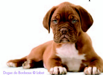
Dogue de Bordeaux

Tout au long des 12 premiers mois de la vie, Chiot prendra connaissance avec son environnement, découvrira les règles de vie sociale avec ses congénères... Une aventure fabuleuse que vous pourrez lui assurer en lui offrant le meilleur départ dans la vie !